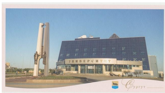
Рисунок 9. Сургутский государственный университет

8. Название: Сургутский государственный университет (рисунок 9).