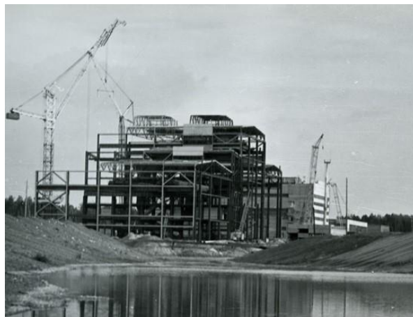
Рисунок 5. Монтаж корпуса под первый энергоблок Сургутской ГРЭС-1

5. Название: Монтаж корпуса под первый энергоблок Сургутской ГРЭС-1 (рисунок 5).