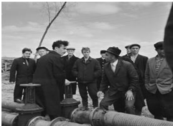
Рисунок 2. Пуск нефти для перекачки в нефтеналивную баржу. 1964 год

2. Название: Пуск нефти для перекачки в нефтеналивную баржу. 1964 год (рисунок 2).