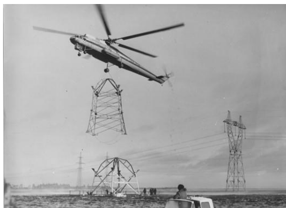
Рисунок 8. Строительство переходной опоры ВЛ 220 КВ. 1960-е годы

7. Название: Строительство переходной опоры ВЛ 220 КВ. 1960-е годы (рисунок 8).