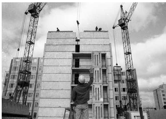
Рисунок 6. Строительство нового района. 1987 год

6. Название: Строительство нового района. 1987 год (рисунки 6, 7).