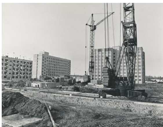
Рисунок 7. Строительство нового района. 1987 год

7. Название: Строительство переходной опоры ВЛ 220 КВ. 1960-е годы (рисунок 8).