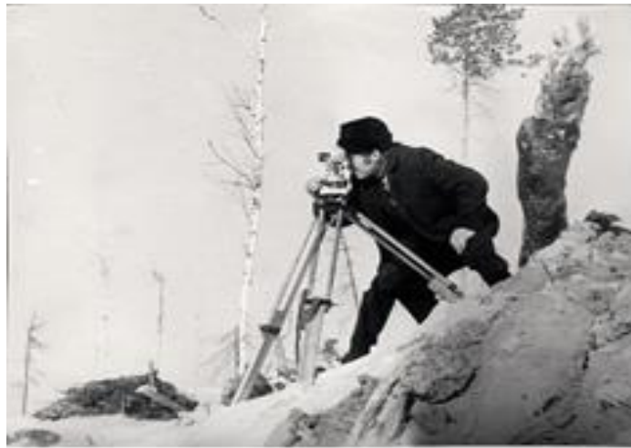
Рисунок 1. Геодезист. 1960-е годы

1. Название: Геодезист. 1960-е годы (рисунок 1).